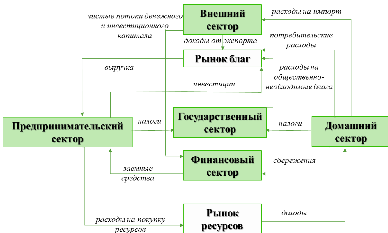
Рис. 1. Структура взаимосвязи экономических субъектов

Государственный сектор не только создает общественно-необходимые блага, но оказывает непосредственное влияние, как на характер взаимодействия экономических субъектов, так и результаты их хозяйственной деятельности путем проведения кредитно-денежной и налогово-бюджетной политики.